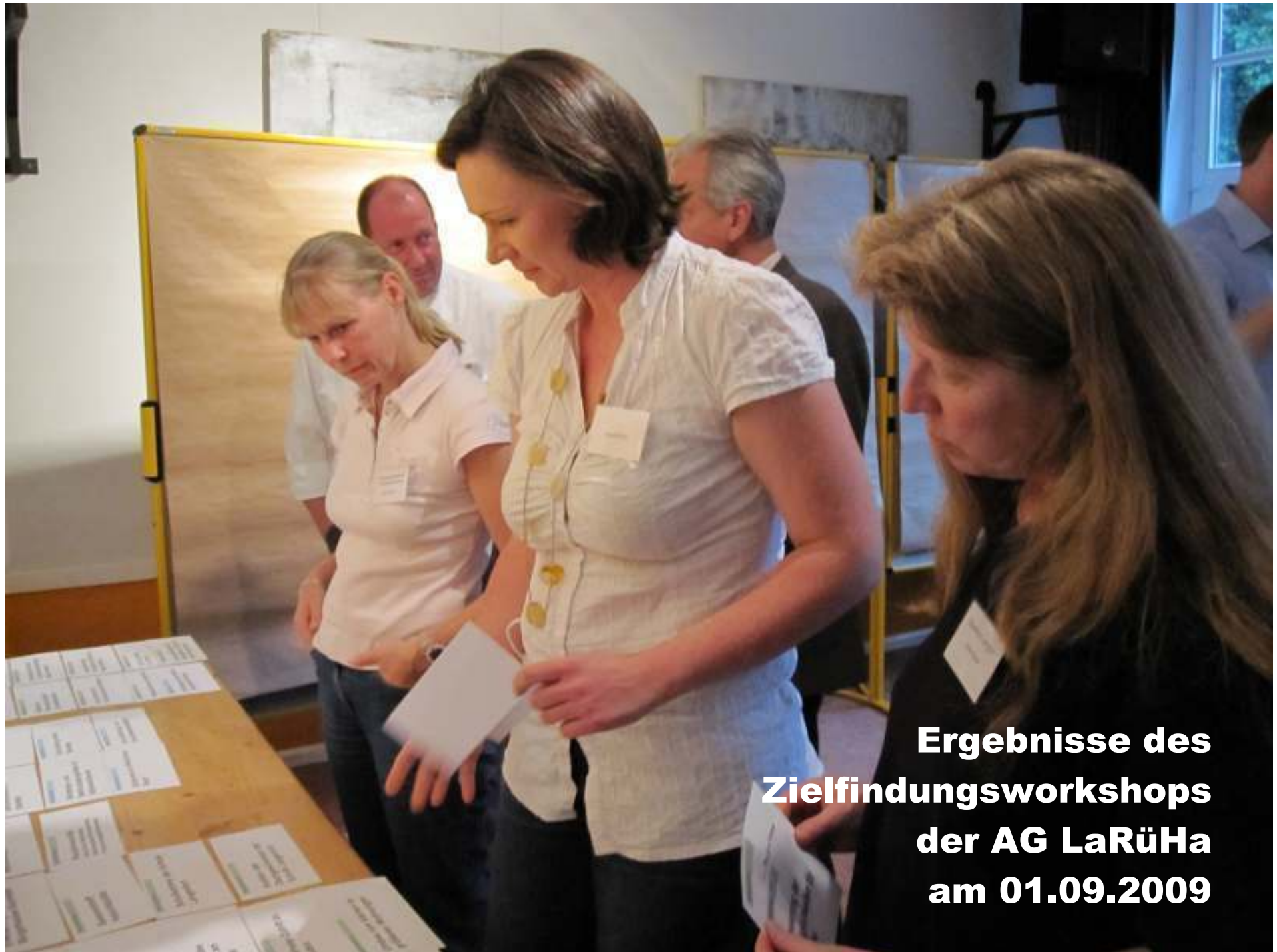
Ergebnisse des Zielfindungsworkshops der AG LaRüHa am 01.09.2009